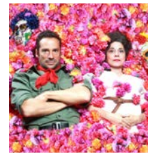
מהומה רבה על לא דבר

עשו מנוי להצגות הטובות ביותר בישראל 1-700-707-990