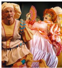
עוץ לי גוץ לי