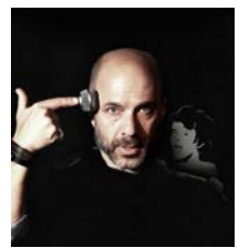
סוס אחד נכנס לבר